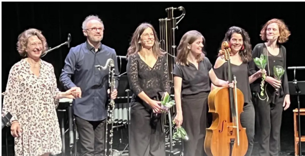
Atmusica montrait, une fois encore, l'engagement de ses musiciens à faire vivre la musique contemporaine.

Publié le 15/05/2023 à 18:24 | Mis à jour le 15/05/2023 à 18:24