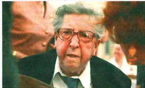
Décédé en mai 2013, le compositeur Henri Dutilleux garde une place importante dans le paysage chinonais.